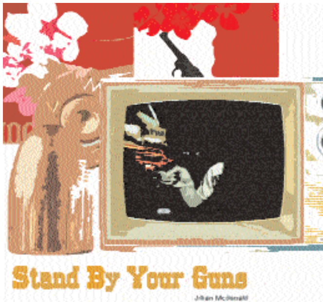
Ilustración basada en la obra Stand by Your Guns , de Jillian McDonald.